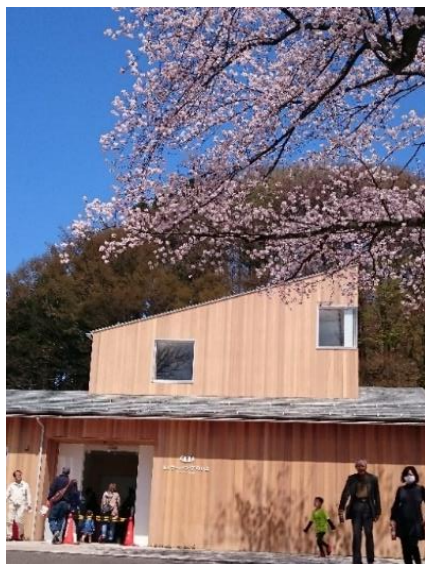
完成した新パンダ舎

日本一(?) 小さな動物園かもしれませんが、しっかりと存在感を示してくれるでしょう。