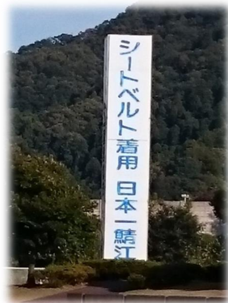
後部座席のシートベルトもよろしく

なお、これらの都市宣言は市のホームページに掲載し、市民へアピールしていくとのことでした。